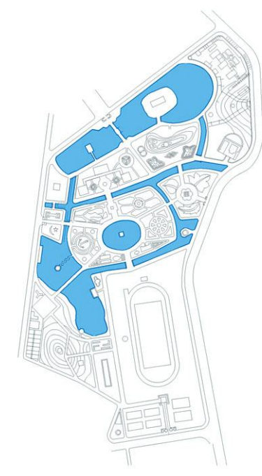
图2 早期中山公园水景分布图（1927年）