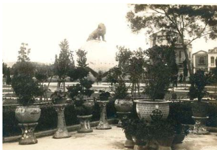
图6 厦门中山公园醒狮球老照片