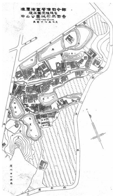
图1 厦门中山公园地形平面图：早期厦门中山公园规划图