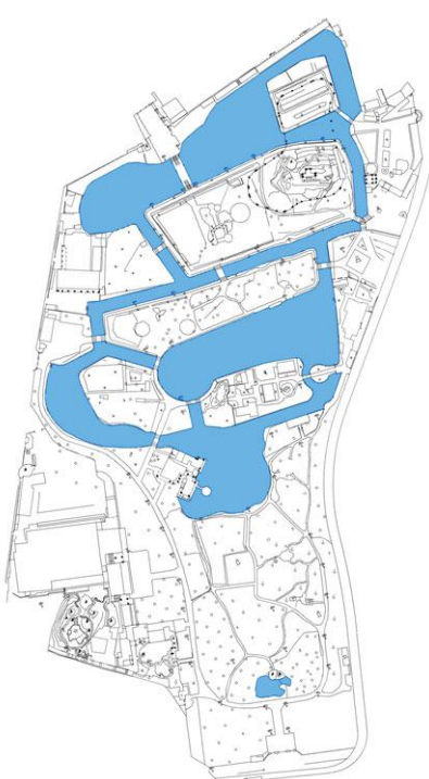
图4 现存中山公园水景分布图