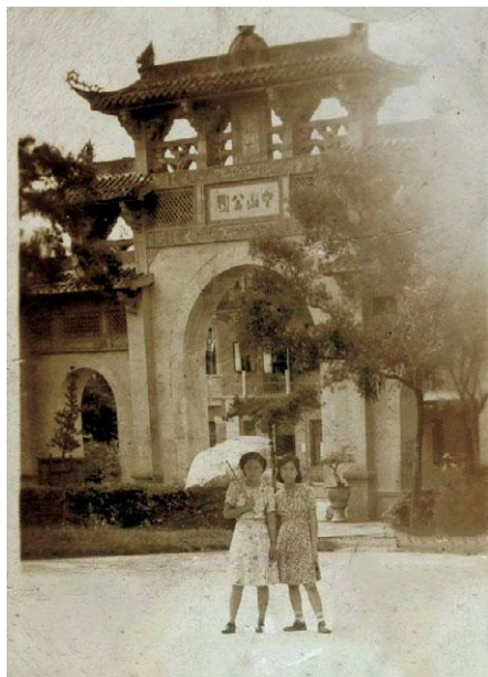
图7 厦门中山公园南门老照片