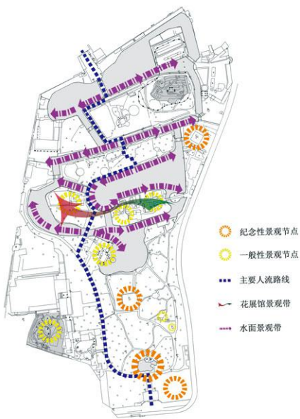
图10 现存厦门中山公园景观与人流路线分析图

面的图书馆等中西合璧式建筑，还有醒狮球（图6）、华表等纪念性雕塑。雕饰华丽，尤以四座大门和钟楼最为出众。其中东西二门和钟楼还于内部设有楼梯，可顺梯而上直达顶层。园内小品建筑，尤其是临水而建的亭台楼阁，如水心亭、船厅等，色彩艳丽，意在使其“互映水中而成绝美之倒影也” ③ 。桥也各具特色，有仿颐和园玉石桥而建的彩虹桥，仿杭州西湖玉带桥而成的晓春桥，通向水心亭的九曲桥等，风格多样，形式精美，与原有历史建筑交相辉映，文化艺术气息十分浓厚。