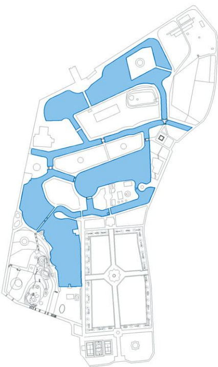
图3 中期中山公园水景分布图（20世纪60年代）