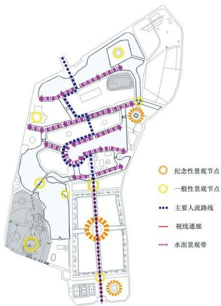
图9 中期厦门中山公园景观与人流路线分析图