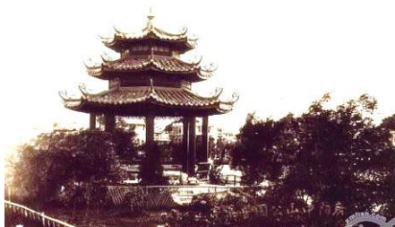
图5 厦门中山公园音乐亭老照片