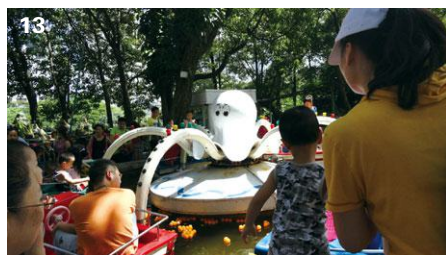
图11 厦门中山公园人流高峰期游人现状 图12 厦门中山公园游人现状之一 图13 厦门中山公园游人现状之二 图14 厦门中山公园魁星山摩崖石刻

军攻陷厦门后占据道署的一段历史。还有首任美术专科学校校长黄燧弼 ⑤ 历时两年所作的寓意深远的醒狮球，虽球体已毁，但狮子还在。