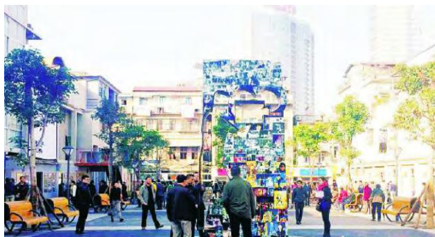
图3 “老剧场”文化公园的叙事主题

“老剧场”文化公园是一个已实施且很成功的公共空间改造案例(图3),而营平的文化需要更多的叙事空间来表达。历史的变迁给营平旧城区留下了深厚的积淀,类似文化公园这样的叙事性空间在营平片区范围内普遍存在,每一段历史;每一处环境都蕴藏着故事,成为公共空间整体网络构架中的一个要素,它们共同承载着整个厦门城市的历史记忆,如图4。