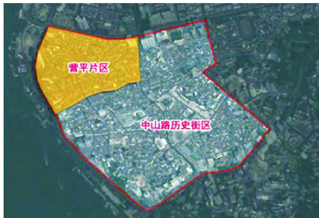
图1 营平片区所在的位置及范围

三百多年前,郑成功部将洪旭安营扎寨于此,因安营在平地上,故始称“营平”。明朝洪武年间,倭寇侵犯厦门海域,政府为了加强防卫而构筑厦门城,“厦门”因此得名,当时岛民和驻兵都集中在鹭江与筓筓港交汇的缓坡陆地上,即现在营平辖区的平原地带。之后,随着漳州和泉州大量人口的不断涌入,厦门聚集了人气。明朝中叶,私人海上贸易开始并迅速发展,在航运贸易的刺激下造船业随之兴盛。到了明末清初,郑成功驻师厦门,为筹集军饷,鼓励通商,经济利益活动极大地推动了厦门的城市发展,届时,沿着鹭江从浮屿到水仙宫(现鹭江道上大同路以南)一带,嘉禾广袤,码头毗连,鱼虾满港,舟楫穿梭,逐渐繁衍成城市。所以,营平片区是厦门港口城市的发祥地,是厦门对外交流、开放最早的地方。六百多年来,许多人文景观和历史遗迹,或烟消、或存留、或改变,它们都有一段值得记取的故事。与此同时,营平片区也存在着厦门老城区所共有的甚至是更为严重的城市问题。营平凭借着优越的地段位置,因居住环境恶劣而低廉的租金,已然成为厦门市的居住盆地,是大量外来人口的首选暂居地。营平当前居住人群构成复杂,原住民正在不断流失,房屋破旧;大量公共空间被侵占;道路拥挤;居住环境不断恶化,许多传统历史文脉开始断层,这大大加重了营平的改造压力。