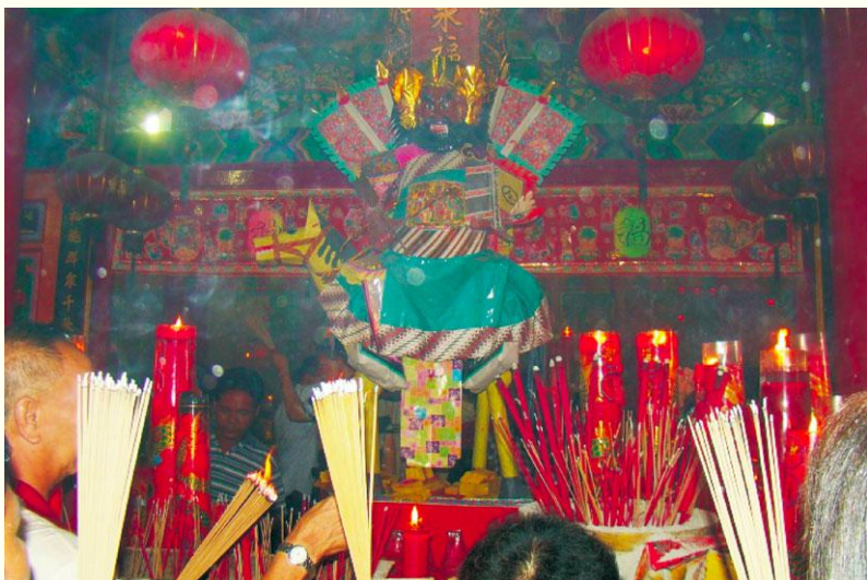
图2 永福宫2009年所请的王爷（引自《东南亚行客——龚泉元的博客》）