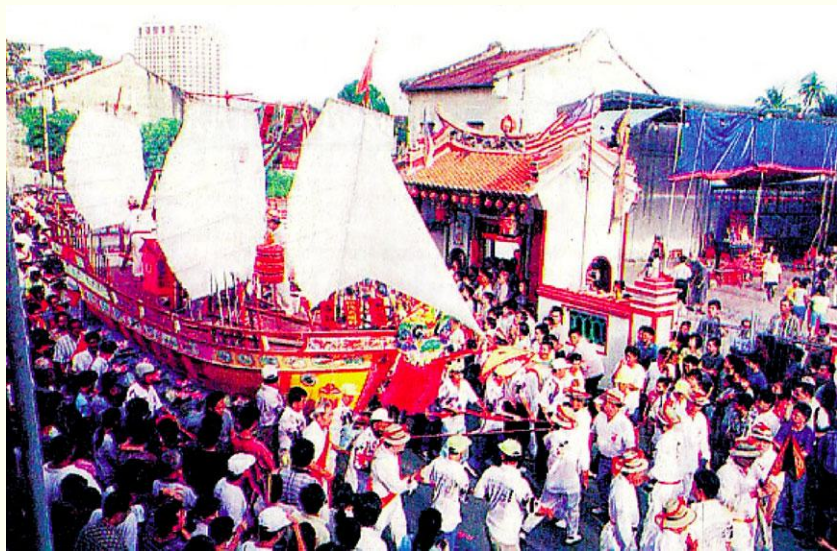
图10 2001年勇全殿王船巡境

整,道士唱诵护身的《西斗经》;12时整,设敬三献,在道士的引导下,宫庙的理事们为王爷三献祭品;下午1时半,宣《三元真经》(下品);3时整,唱诵《解年经》;晚上7时整,祝百神灯,祈座主神光普照;8时整,为众善信补运;10时正,高燃秉烛,燃祥光庇佑万民。