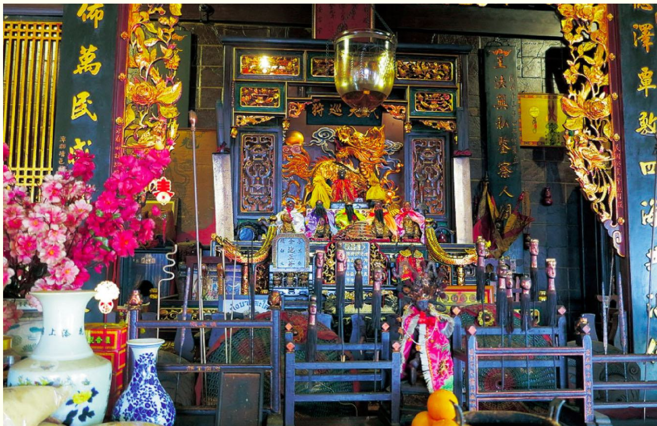
图7 马六甲怡力勇全殿正殿

个炮口，船头的舷板上饰有狮面。据报道，王船先供于崇龙宫前，下午四点，村民自备祭品前来崇龙宫，举行“船头祭”和宴王仪式，而后协力将王船抬至海边王船地焚化，并恭迎王爷出巡，在石文丁村各处巡游、驱邪、赐福。除了本地人参