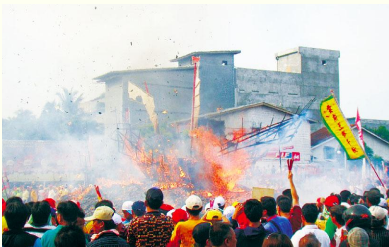
图4 2009年巴眼亚比王船祭仪式中的烧王船

师的指导下，这些同安籍的当地居民开始建庙（永福宫）祭拜纪王爷，并举办俗称“送王”的王船祭仪式，洁净地方与海域空间，以安抚海上遇难的游魂，庇佑众生及赐福众生，祈愿渔民海产丰登。这以后，每隔几年举办一次，直到1967年苏哈托政府下令禁止，这种“烧王船”的请王、送王仪式才被迫停止举行。