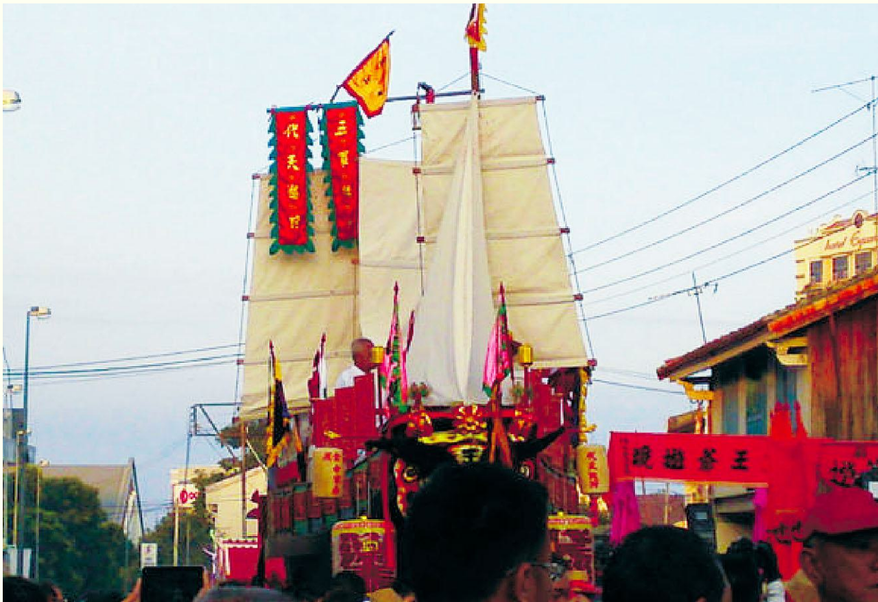
图11 马六甲勇全殿2012年的王船巡游