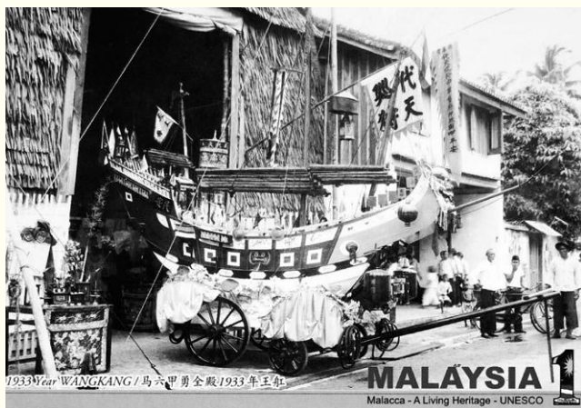
图8 1919年马六甲勇全殿王船巡境

马来西亚最著名的王船祭为2013年6月被评为马来西亚国家文化遗产的马六甲万怡力勇全殿举办的马六甲王船祭。相传勇全殿始建于1811年（嘉庆十六年），其主祀神明池府王爷的香火来自泉州府同安县马巷（今属厦门市翔安区马