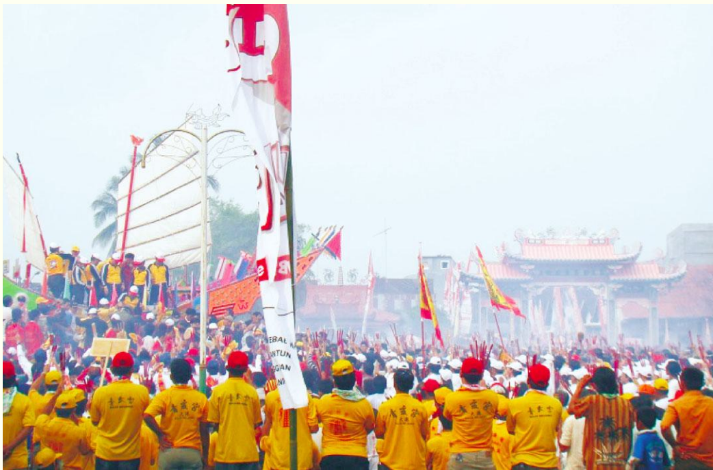
图1 印尼巴眼亚比供奉纪王爷的永福宫

王船祭是闽南人为适应海洋生活在明代形成的祭祀神明、超度亡魂、洁净空间、祈求平安的大型仪式，其仪式过程有请王、造王船、竖灯篙、祀王、宴王、巡境、迁船、送王（烧王船）等。