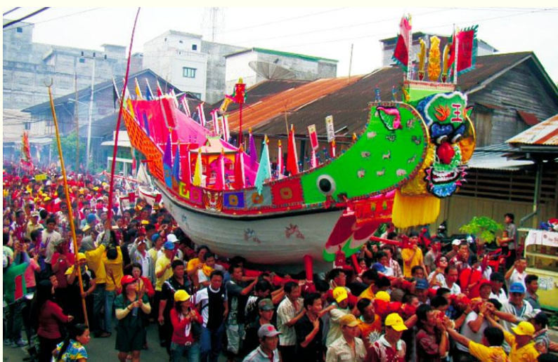
图3 永福宫2009年巴眼亚比王船祭的王船巡境（引自《东南亚行客——龚泉元的博客》）