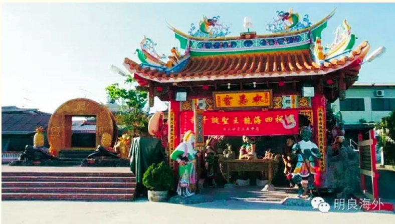
图6 马来西亚柔佛州峇株巴辖石文丁村崇龙宫

马来西亚柔佛州峇株巴辖（Batu Pahat）的石文丁（Segenting）渔村的崇龙宫始建于1932年，其主祀龙王，也供奉池、李、包“三府王爷”，为当地华人的信仰中心和精神寄托之所。该村于2002年农历五月十八日（2002年6月28日）池府王爷千秋日举行了三十年一度的王船祭和王爷巡境赐福活动，其目的是为了祈求国泰民安、村民工作顺利和生活愉快。这次王船祭，当地人制作了一大二小三艘纸扎的王船，大的王船长26尺、宽12尺；小的王船长10尺、宽5尺。从照片看，大的王船为宽头的福船体官船模样，船舷上有7